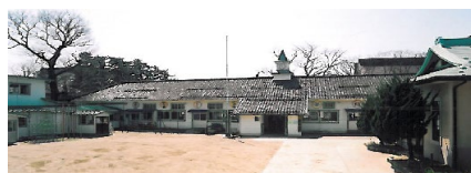
旧酒田幼稚園園舎