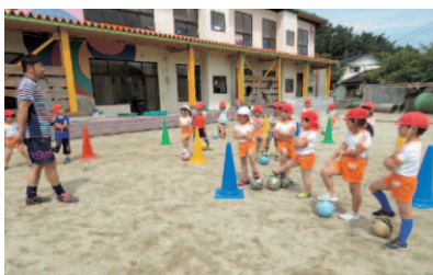
年長組：サッカー指導