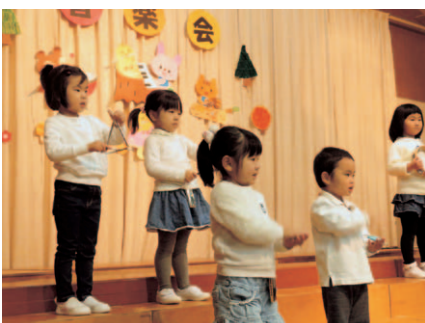
年少組：楽器に触れ親しむ指導