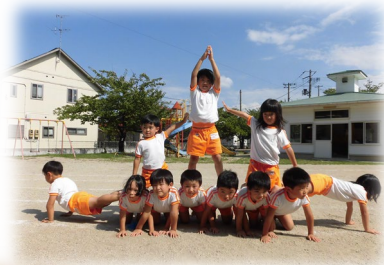
秋：運動会（組立体操）