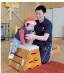
未満児組：跳び箱指導