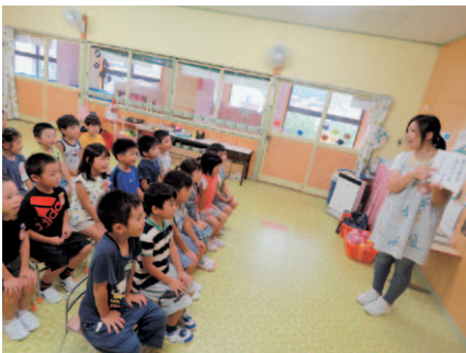
年長組：言葉に触れる指導