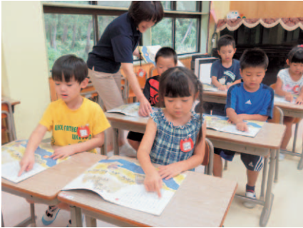
年長組：文字に触れる指導

文字・数量・図形への関心・感覚をもつことにより、日常生活に活用する態度を育てます。